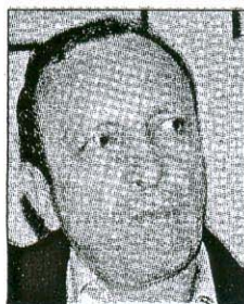
Terzić: Jedina akreditacija u BiH