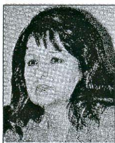
Oruč: Pomoć države

zić kaže da „Institutu i pored silnih rezultata i priznanja nedostaje državna potpora, iako je posao koji rade, ustvari, posao državnih institucija“.